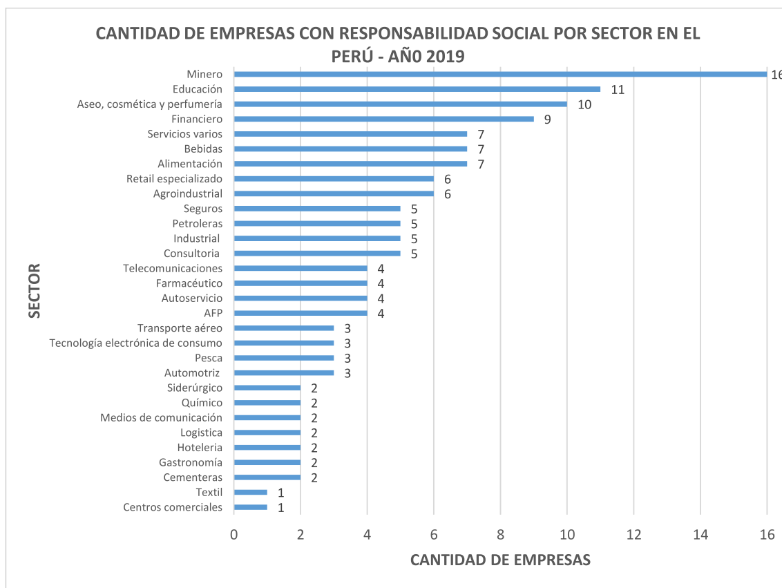
Figura 6. Cantidad de empresas con responsabilidad social por sector en el Perú – Año 2019, adaptado de (MERCO. Monitor empresarial de reputación corporativa, 2019)

En primer lugar en la Tabla 1 del ranking de las 50 empresas líderes en responsabilidad social en Perú, se encuentra una entidad financiera, luego de la evaluación de los compromisos sociales (elaboración de proyectos y ejecución de obras de infraestructura y sociales, patrocinar eventos culturales, académicos, deportivos, etc.), ambientales (cuidado con el medioambiente, programas de reciclaje y ahorro de energía, etc.) y con la sostenibilidad (la transparencia, ejercicio ético de la actividad, cumplir con la normatividad, buscar soluciones innovadoras, desarrollar acciones para el fortalecimiento del sector, etc.).