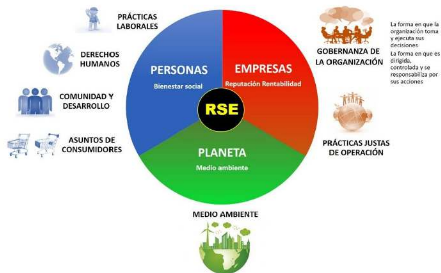
Figura 2. Representación de responsabilidad social empresarial. Adaptado de Materias Fundamentales de Responsabilidad Social (ISO 26000:2010, 2010)

Incluye desde controles para no publicitar engañosamente, hasta el fomento del consumo responsable pasando por el respeto a los derechos de propiedad, la promoción de mercados abiertos o los mecanismos de atención al cliente pre y postventa (Moreno Prieto, 2015), considerando el aspecto interno; también mide los impactos en la comunidad que pueden ser en: salud, educación, empleo, disminución de la pobreza, crecimiento económico, inclusión, aprovechamiento sostenible de recursos, respeto por el medio ambiente, entre otros.