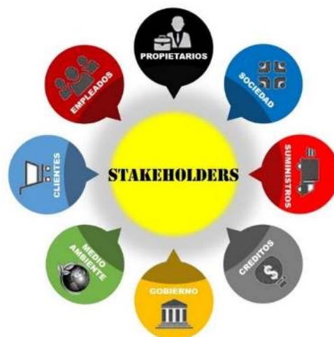
Figura 1. Modelo de stakeholders