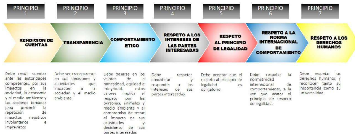
Figura 3. Representación de los principios de la ISO 26000. Adaptado de (ISO 26000:2010, 2010)

La Norma ISO 26000 establece 7 materias fundamentales de la responsabilidad social que una organización deberá de abordar: