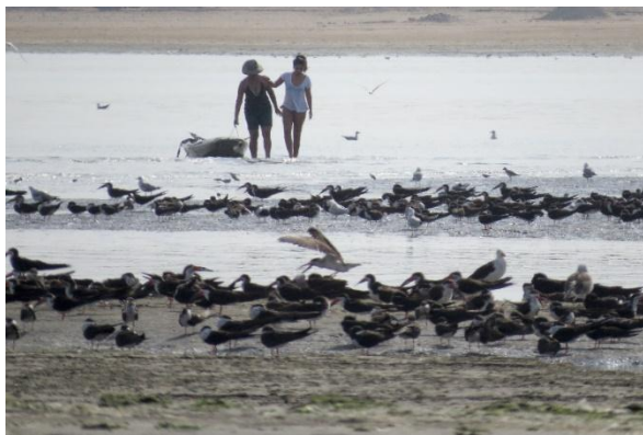
Foto 2. Personas ingresando desde el mar a la orilla de playa para observar aves.