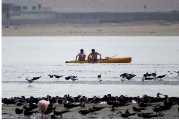
Foto1. Personas desplazándose en kayak, cerca a la orilla de playa.