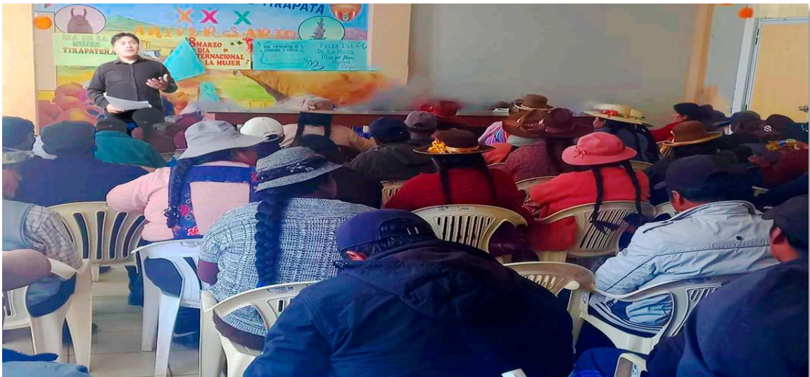
Descripción. Aplicación de encuestas en la comunidad de campesina de Jila Purina.