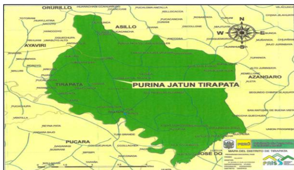
Mapa del distrito de Tirapata

Nota. Ministerio de desarrollo e inclusión social (2020)