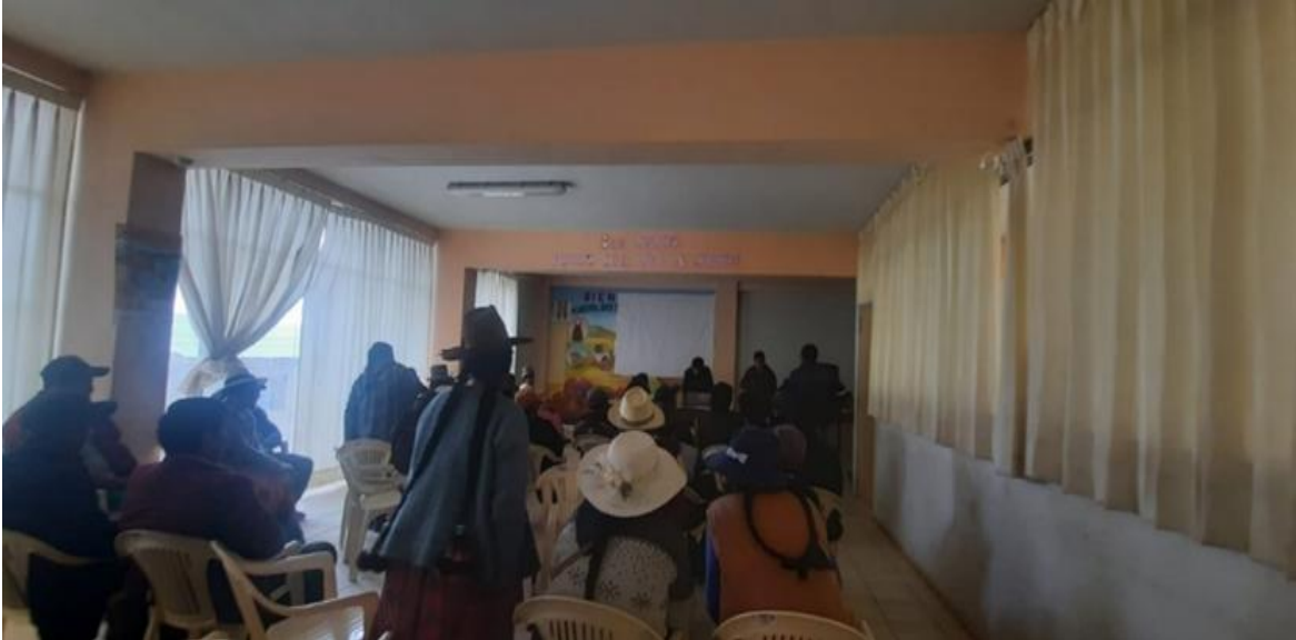
Descripción. Aplicación de encuestas en la comunidad de campesina de Purina.