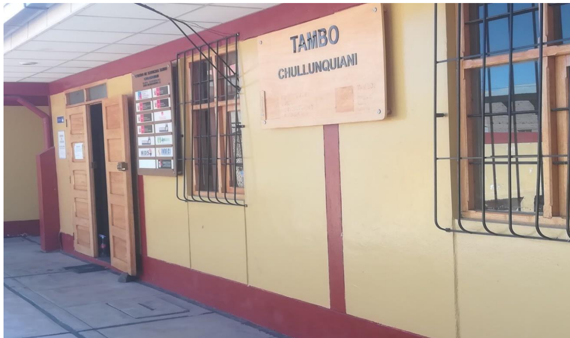
Infraestructura de la plataforma del Tambo de Chullunquiani, se puede observar el patio común en donde los pobladores realizan sus actividades.