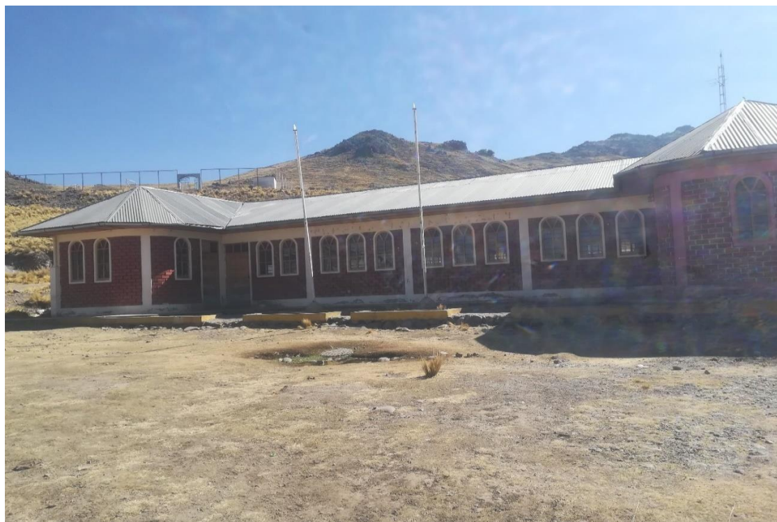
Institución educativa de la comunidad de Chullunquiani.