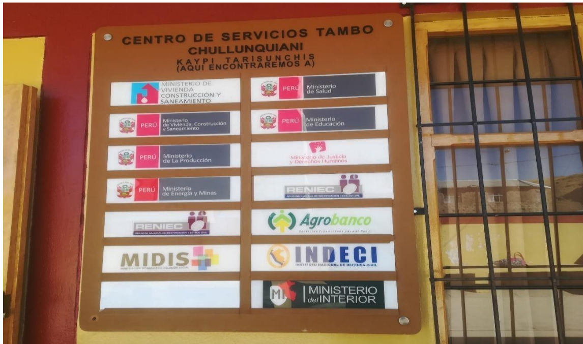
Panel del Centro de servicios del Tambo de la comunidad Chullunquiani.