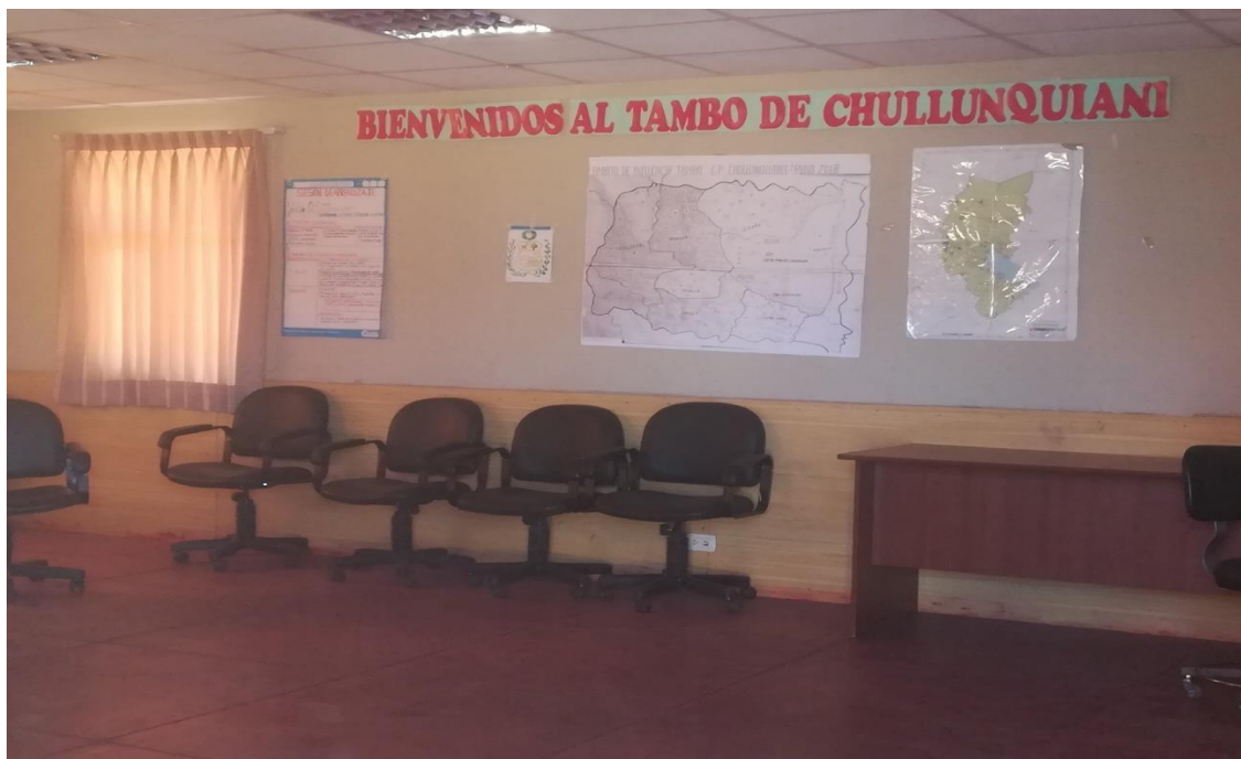
Auditorio del tambo de la comunidad de Chullunquiani, se puede apreciar el auditorio, con equipamiento y materiales para que los pobladores realicen sus capacitaciones, reuniones.