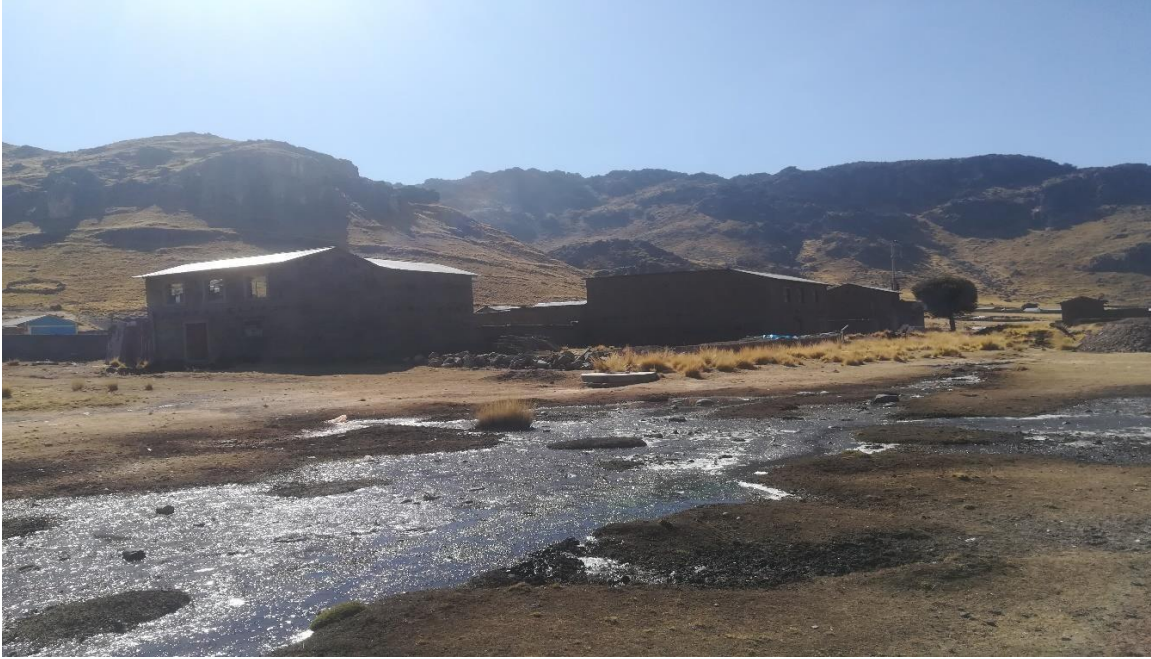
Vista panorámica de la comunidad de Chullunquiani,